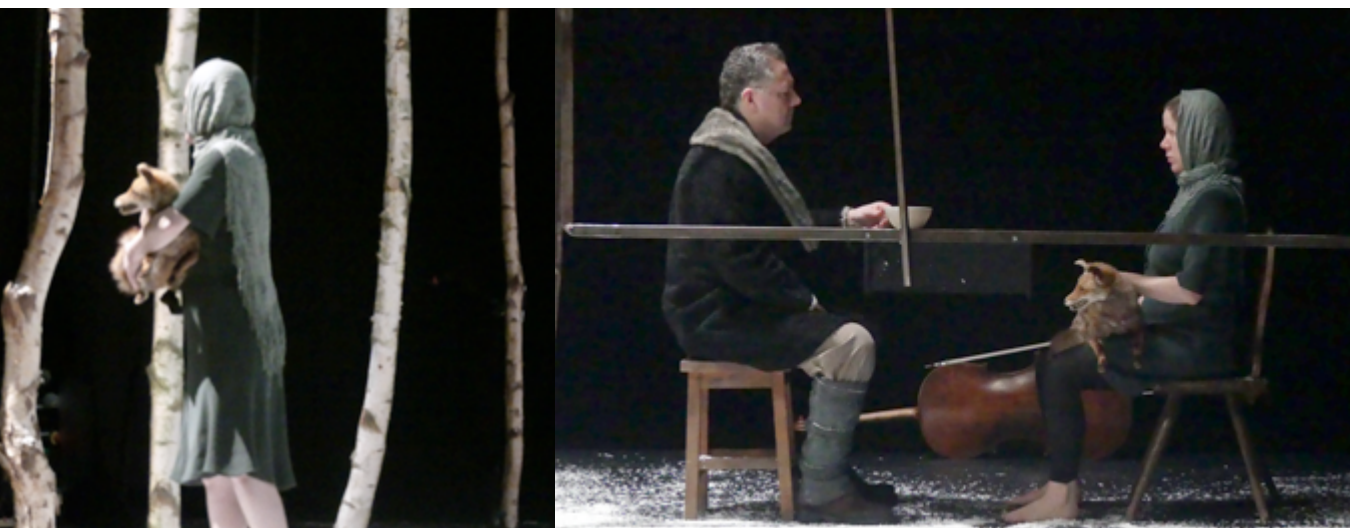
" Les personnages n'ont pas l'air de vivre, mais de vivre une vie racontée " Cocteau pour La Belle et la Bête

Danse et musique sont en dialogue constant, vivants l'un et l'autre et une part d'improvisation est laissée aux interprètes à chaque représentation.